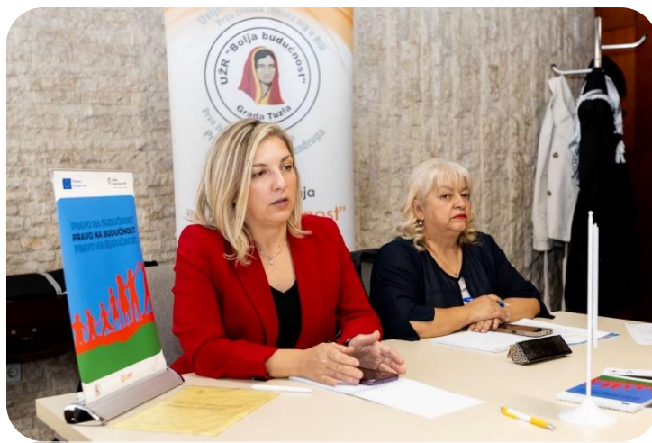
Fotografija: Nacionalni okrugli stol, „Transformativno obrazovanje: Osnaživanje marginaliziranih žena i djevojaka za bolju budućnost“; Oktobar 2025. godine

Okrugli stol okupio je stručnjake iz oblasti ljudskih prava, predstavnike nevladinih organizacija, institucija i donosioce odluka kako bi zajednički unaprijedili prevenciju i borbu protiv trgovine ljudima u romskim zajednicama. Učestvovalo je 25 predstavnika relevantnih ministarstava na kantonalnom nivou, Centra za socijalni rad, policijske uprave, te predstavnici nevladinih organizacija koje djeluju na području Tuzlanskog kantona. Poseban fokus bio je na obrazovanju kao preventivnom faktoru, s akcentom na razvoj romskih učenika, posebno djevojčica Romkinja.