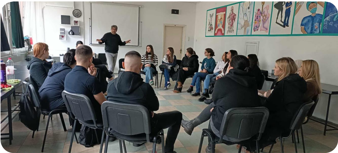
Fotografija: Radionica sa mladima – JU Srednja medicinska škola Tuzla – decembar 2025

U projekt je direktno uključeno 21 mladih (13 djevojaka i 8 mladića), dok je indirektno obuhvaćeno više od 300 osoba kroz dijeljenje stečenih informacija među vršnjacima. Udruženje već godinama radi na promociji romske kulture i očuvanju identiteta, što doprinosi širem dosegu ovih aktivnosti.