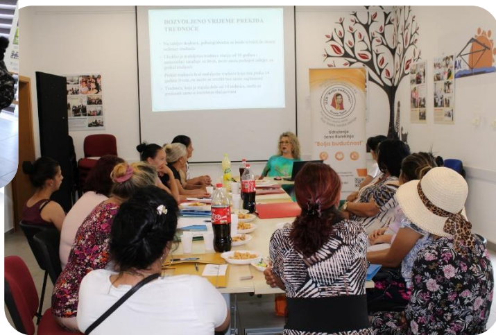
Fotografija desno: Radionica „Unapređenje seksualnog zdravlja i planiranje porodice“ održana 09.06.2025. godine u Društvenom centru Kiseljak