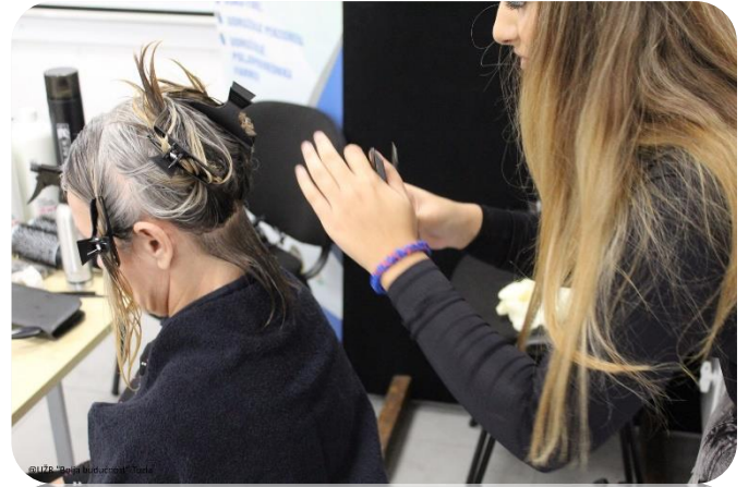
Fotografije: Radionica u Društvenom centru Kiseljak održana 10.01.2025. godine