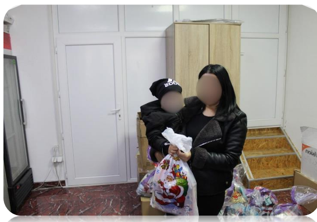
Fotografija: Podjela novogodišnjih paketića korisnicima/ama

Ova aktivnost unijela je radost i praznični duh među djecu, te im omogućila da osjete pažnju, podršku i toplinu zajednice. Naš cilj je pružiti im trenutke sreće i podržati porodice kojima ovakav vid pomoći mnogo znači.