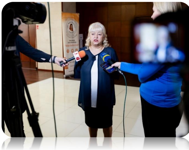
Fotografija: Nacionalni okrugli stol, „Transformativno obrazovanje: Osnaživanje marginaliziranih žena i djevojaka za bolju budućnost“; Oktobar 2025. godine