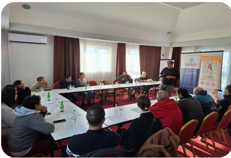
Fotografija: Travnik 16.01.2025. godine. Održana jedna od radionica posvećena jačanju romske zajednice u borbi protiv trgovine ljudima

Aktivnosti su prekinute odlukom predsjednika SAD Donalda Trump-a o prekidanju svih oblika američke inostrane pomoći. Nakon prekida aktivnosti projekta, zahvaljujući zagovaračkim aktivnostima nas i naše partnerske organizacije „Zemlja djece u BiH“, formirani su MIT timovi u Kaknju, Travniku i Donjem Vakufu a očekujemo i u Sanskom Mostu.