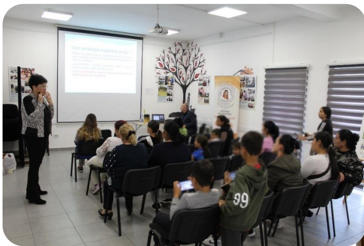
Fotografija lijevo: Radionica na temu oralnog zdravlja održana 19.05.2025. godine u Društvenom centru Kiseljak

Tokom 2025. godine, Udruženje „Bolja budućnost“ realizovalo je projekat zdravstvene podrške romskoj zajednici u Tuzli, u bliskoj saradnji sa JZNU Dom zdravlja dr. Mustafa Šehović Tuzla. Cilj projekta bio je unapređenje zdravlja i higijenskih uslova romske populacije, te povećanje svijesti o prevenciji zaraznih i nezaraznih bolesti, oralnom zdravlju, te seksualnom i reproduktivnom zdravlju.