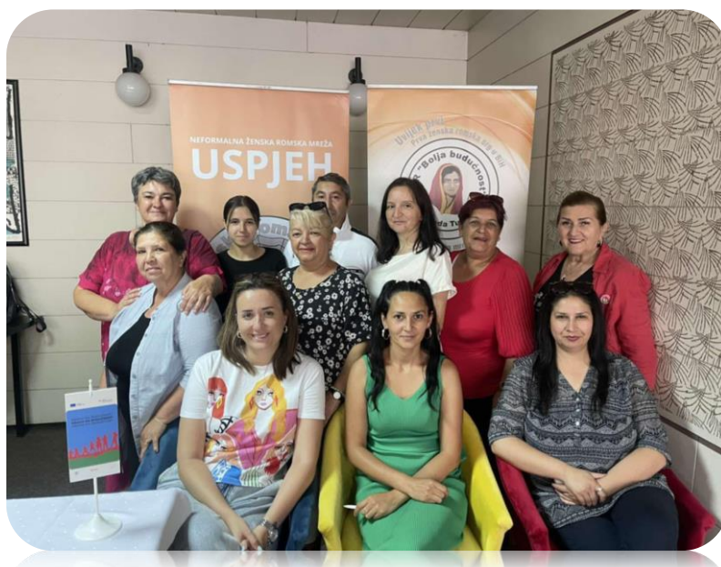
Fotografija: Članice Ženske romske mreže „Uspjeh“ – juli 2025, Sarajevo

Ovim radom, Ženska romska mreža „Uspjeh“ je u 2025. godini dodatno osnažena i pozicionirana kao relevantan akter u oblasti rodne ravnopravnosti i prava Romkinja u BiH.