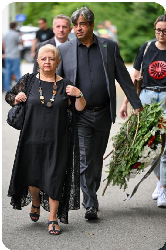
Fotografija: Komemoracija Uštice, Republika Hrvatska–avgust 2025

I ove godine smo organizovali odlazak u Donju Gradinu kako bismo odali počast žrtvama Holokausta – Samudaripen. Posjetu smo realizovali zajedno sa članicama Ženske romske mreže, našim članicama i omladinom. Tokom posjete obišli smo mjesto stradanja, te položili vijence i cvijeće.