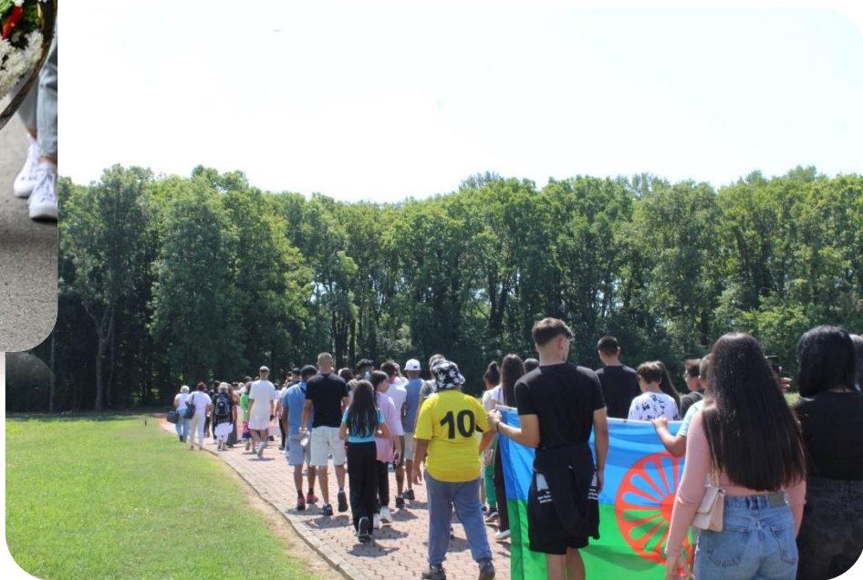
Fotografija: Komemoracija Donja Gradina 2025

U prethodnim godinama posjećivali smo i druga važna mjesta sjećanja, poput Aušvica i Uštica, dok smo ove godine nastavili tradiciju posjete Donjoj Gradini, koju provodimo već 13 godina. Predstavnici našeg Udruženja prisustvovali su i komemoraciji u Ušticama, Republika Hrvatska.