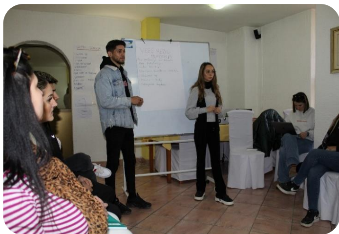
Fotografija: Obuka za vršnjačke edukatore