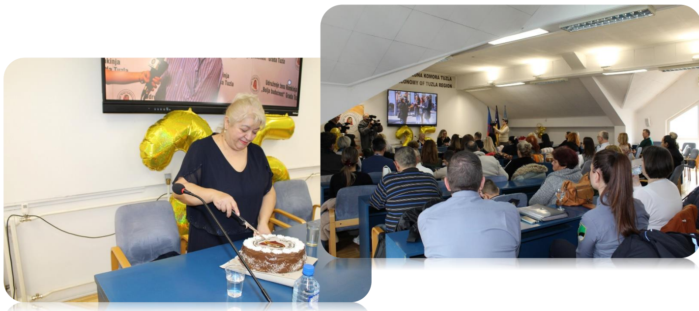
Fotografije: 25 godina posvećenosti, truda i borbe za bolje sutra!

Nastavljamo zajedno graditi bolju budućnost!